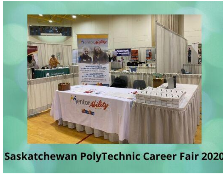
Saskatchewan PolyTechnic Career Fair 2020

The MentorAbility Canada Project was proud to be a gold sponsor for the Saskatchewan PolyTechnic Career Fair 2020 in both Prince Albert, January 22nd and Saskatoon on January 29, 2020.